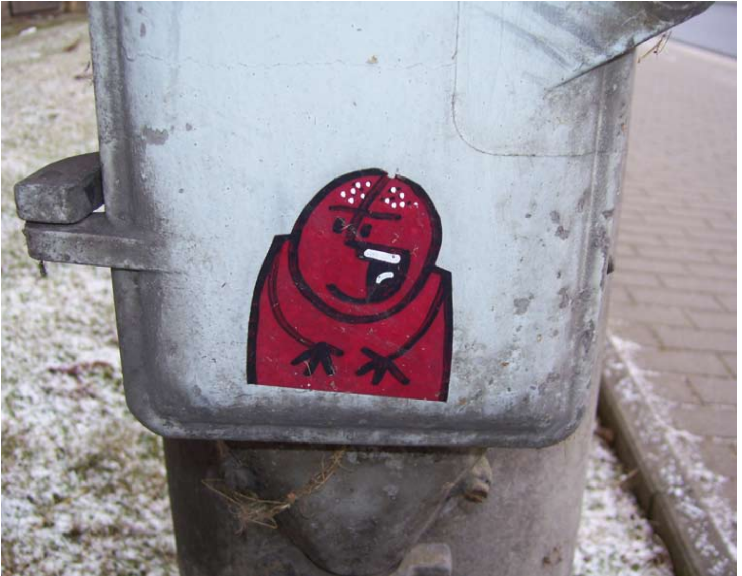
Straßenkunst: Gefunden in Dresden

Die neue BDP Ortsgruppe beschäftigt sich schwerpunktmäßig mit Aktionen gegen Rechts.