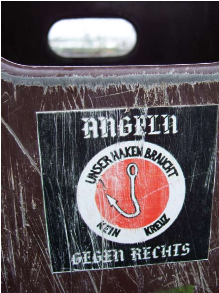
Gefunden in Dresden