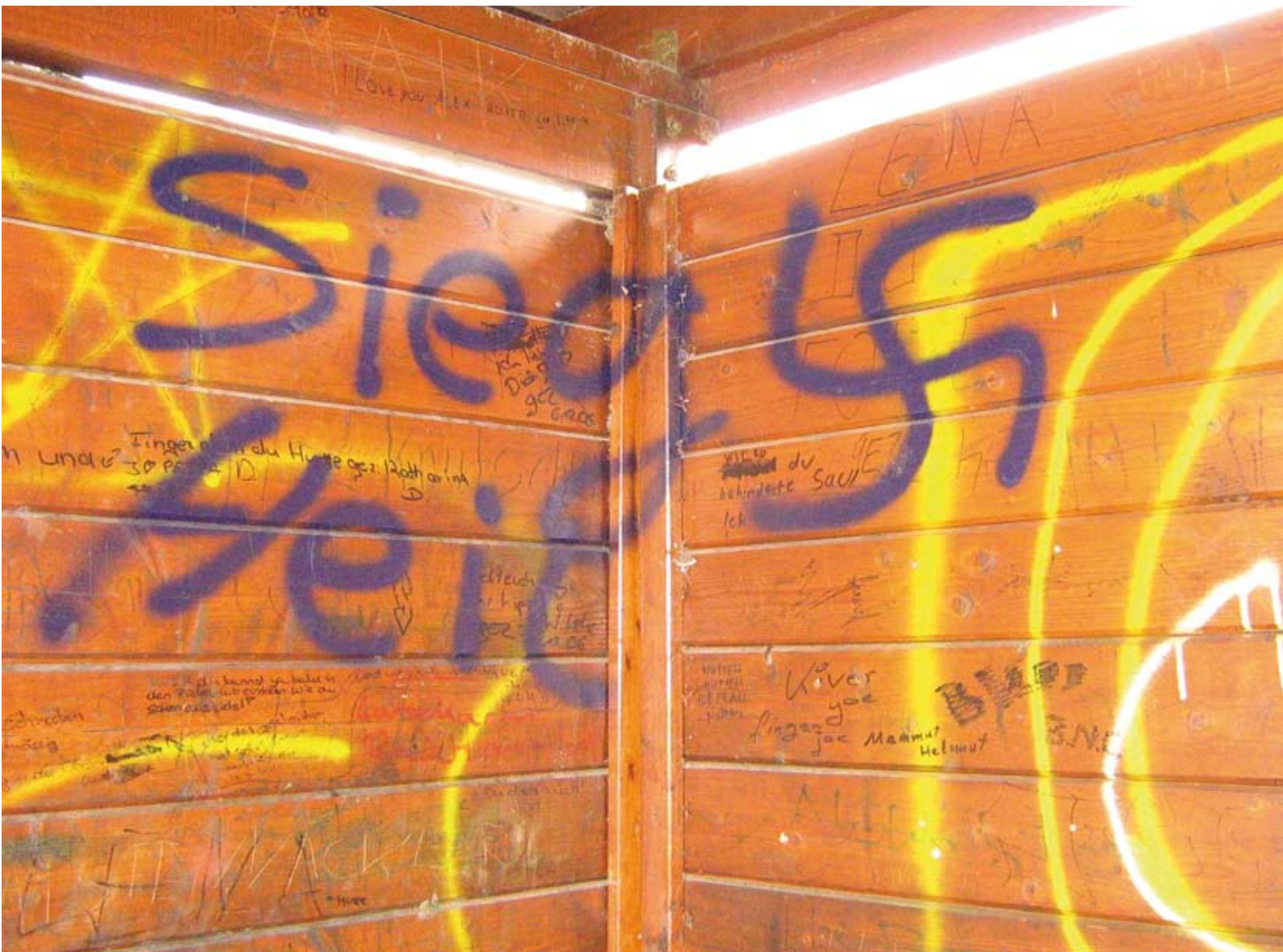
Auch im Westen zu finden: Beschmierte Bushaltestelle in Langenhain in Hessen

haltliche Stellung beziehen, überfordert und allein gelassen.