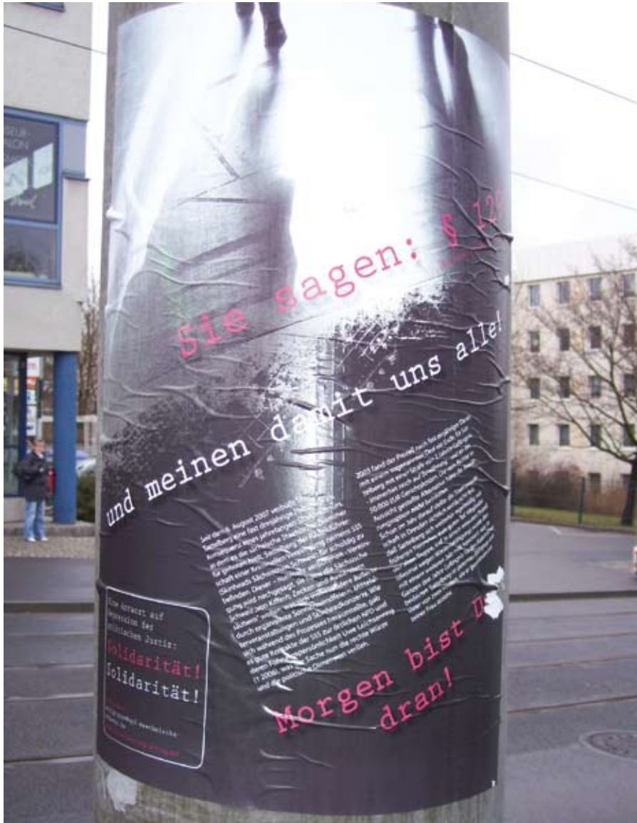
Erst auf den zweiten Blick zeigt sich der wahre Hintergrund ...