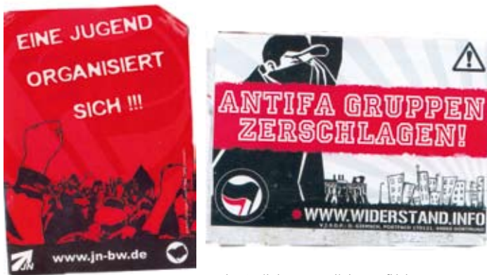
In der Optik kaum von linken Aufklebern zu unterscheiden: diese rechten Sticker wurden am 20.04.08 in Reutlingen in der Fußgängerzone gefunden und entfernt.