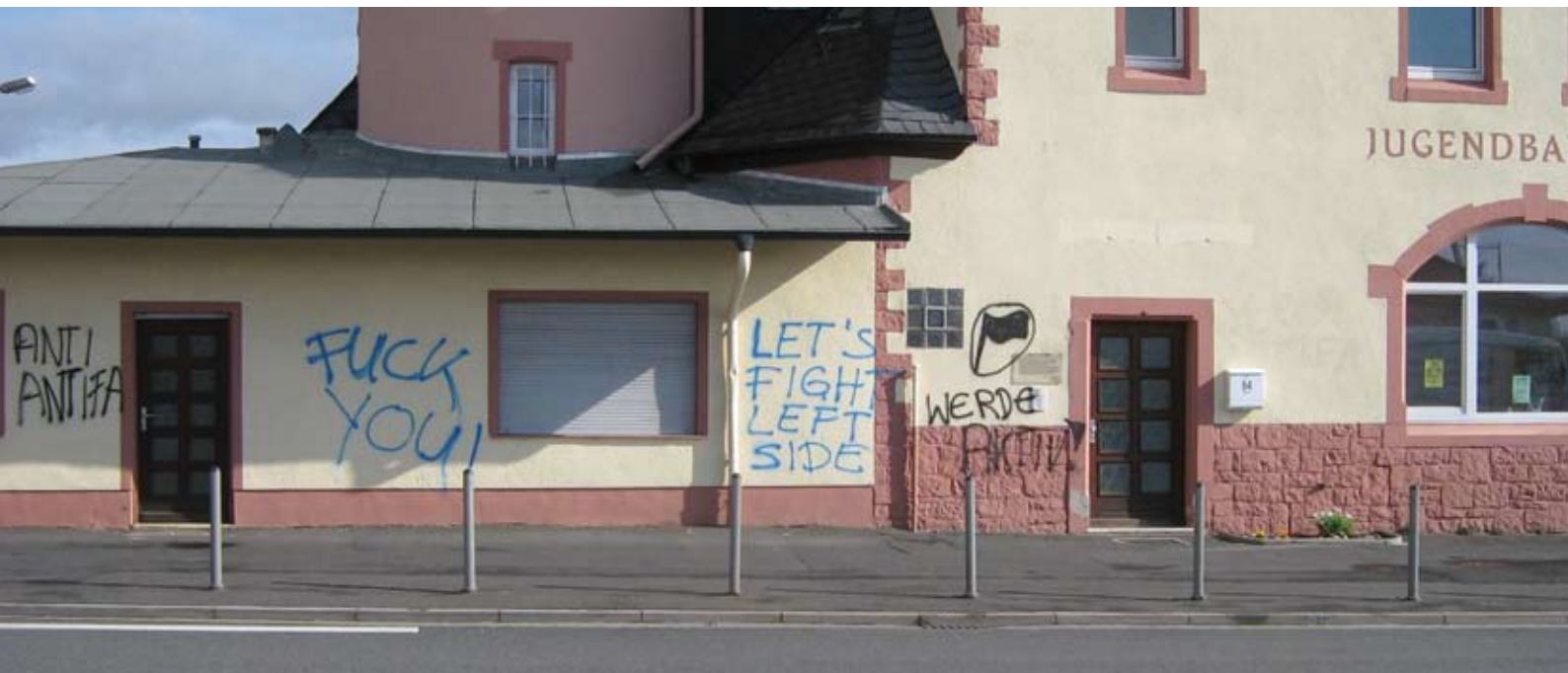
Der Jugendbahnhof in Butzbach am 2. Mai 2008. Abends wurden die Schmiereien von Mitarbeitern der Stadt entfernt

Im Jahr 2005 entstand im Wetteraukreis ein Netzwerk im Kampf gegen Rechts