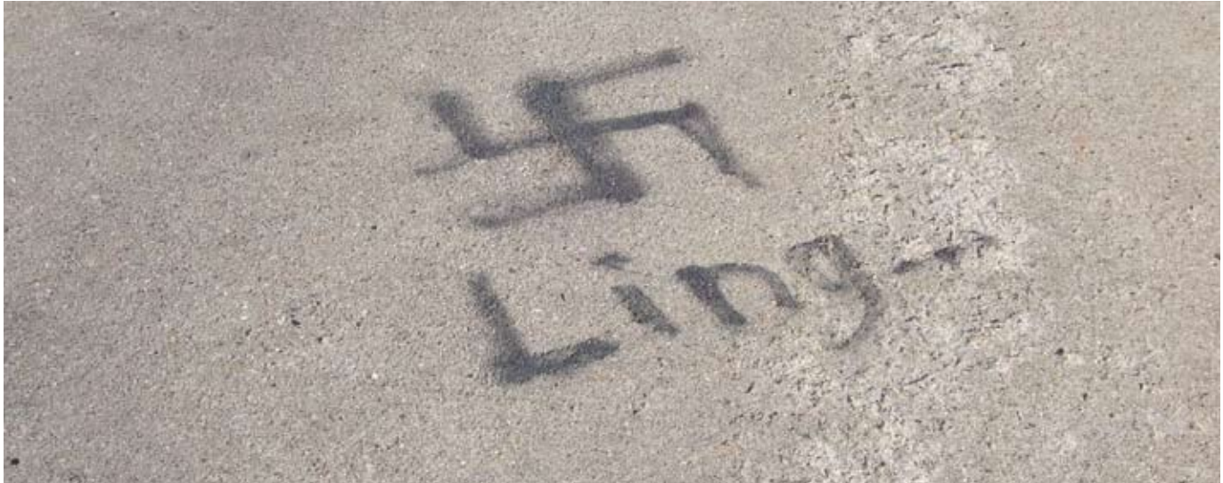
Schmiererei in Beresinchen

Ein Erfahrungsbericht aus Sachsen-Anhalt